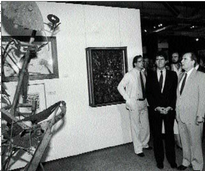
François Mitterrand et Jack Lang visitent le centre Georges-Pompidou.

« J'ai plutôt tendance à redouter l'excès, la surcharge, la fioriture », a confié un jour François Mitterrand au Nouvel Observateur . « Je crois que finalement, j'ai des goûts assez classiques et que les formes géométriques pures m'attirent. » Est-ce parce que ce que sont celles qu'a inventées le « premier XX e siècle », période de formation du futur président ? Ou parce que leur symbolique latente avait de quoi le séduire ? On ne peut qu'être frappé, en tout cas, par l'aspect écrasant, l'emphase monumentale de ces bâtiments voulus par un président de gauche. « De quoi cette pyra-