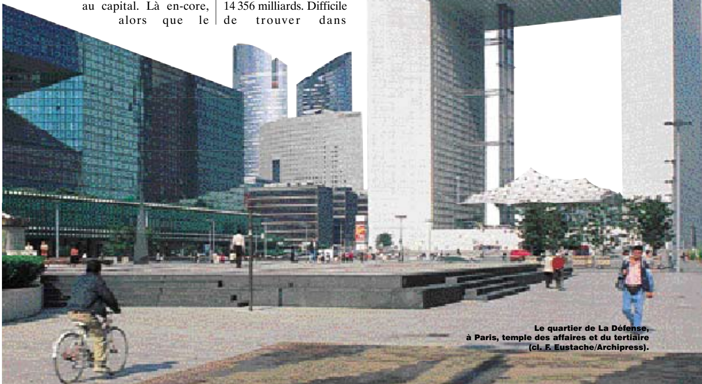
Le quartier de La Défense, à Paris, temple des affaires et du tertiaire (cl. F. Eustache/Archipress).

Dans le même temps, le salaire annuel ouvrier en francs 1995 s'est élevé de 84 500 francs en 1980 à 88 886 francs en 1995, une hausse d'un peu plus de 5 % en quinze ans, soit une quasi-stagnation qui contraste vivement avec les 62 % de hausse enregistrés dans les quinze années précédentes : ce même salaire annuel était passé d'environ 52 000 francs 1995 en 1965 à 84 500 francs en 1980.