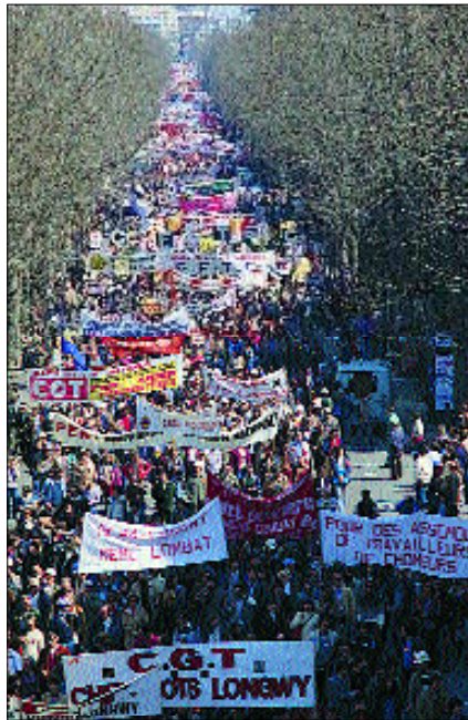
Manifestation dans les rues de Paris, le 13 avril 1984, après l'annonce du « plan acier » prévoyant la suppression de plus de 20 000 emplois dans la sidérurgie.

Dans le même temps, inscrite dans un mouvement de désinflation massif, jusqu'à devenir l'un des grands pays industrialisés les moins inflationnistes, la France a restauré une compétitivité-prix qui a permis à son économie de rétablir son équilibre extérieur et à ses entreprises d'entamer un mouvement d'internationalisation considérable, plusieurs d'entre elles (Alcatel, Car-