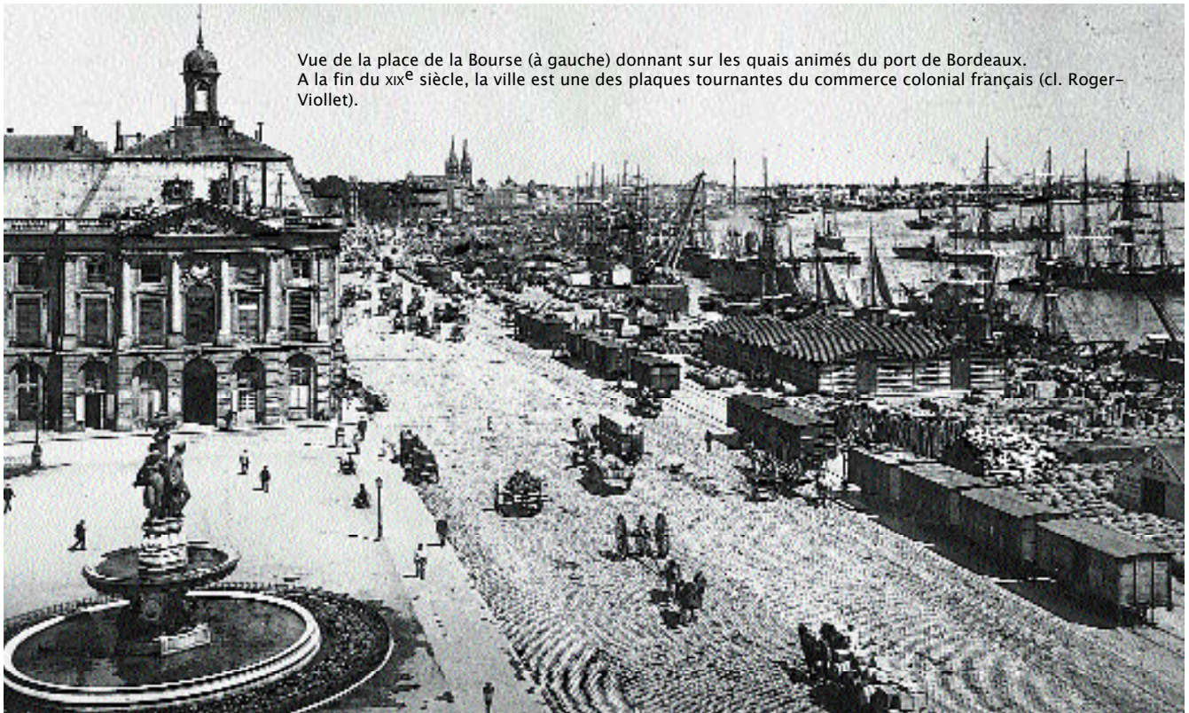
Vue de la place de la Bourse (à gauche) donnant sur les quais animés du port de Bordeaux. A la fin du XIX e siècle, la ville est une des plaques tournantes du commerce colonial français.

trois années de subventions aux compagnies privées de chemin de fer qui s'élevaient à 300 millions par an entre 1910 et 1914, ou encore deux années d'impôts indirects sur les boissons qui rapportaient 500 millions par an vers 1900. A ce prix-là, il aurait vraiment été dommage de se priver de la conquête des colonies !